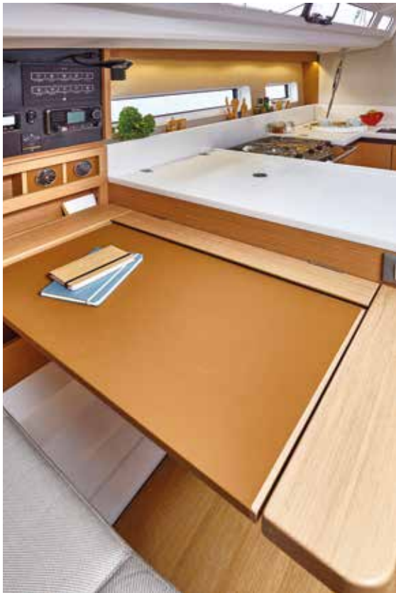
▲ Real chart table Belle table à carte Großer Kartentisch Tarjeta hermosa mesa a carta Bel tavolo da carteggio