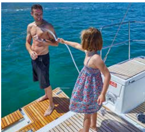
► Cockpit with a wide swim platform Cockpit avec large plateforme de bain Cockpit mit großer Badeplattform Cockpit con gran plataforma de baño Pozzetto con grande piattaforma di poppa