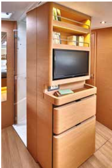
▲ Many spaces of storage and a private head Nombreux rangements et une salle de bain privative Viel verfügbarer Stauraum und ein Privates Waschräume Muchos espacio de almacenaje disponible y un privato baño Molteplici scomparti e armadietti e uno privato bagno