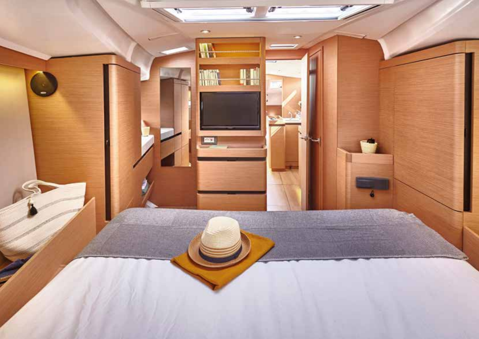
▲ Bright and voluminous master cabin Cabine propriétaire lumineuse et volumineuse Helle und großzügige Eignerkabine Cabina propietario luminosa y espaciosa Cabina armatoriale luminosa e con bei volumi