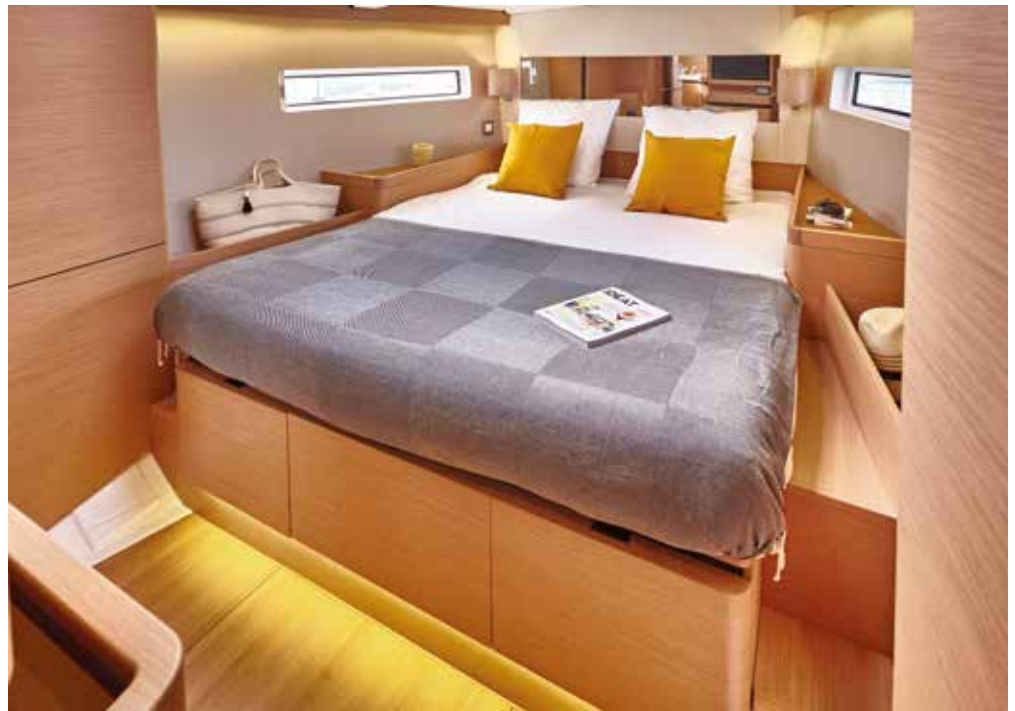
▲ High standard master cabin Cabine propriétaire de haut standing Eignerkabine mit hohem Standard Cabina propietario de alta gama Lussuosa cabina armatoriale