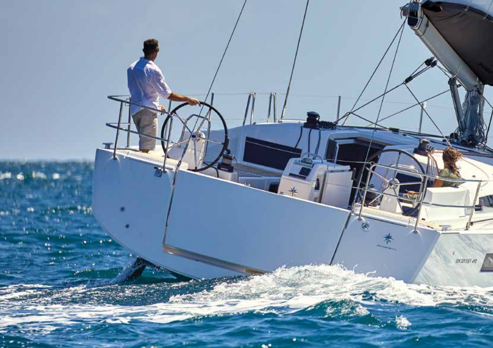
► Comfortable and functional cockpit Cockpit confortable et fonctionnel Komfortables und funktionelles Cockpit Carlinga confortevole e funzionale Cómodo y funcional pozzetto