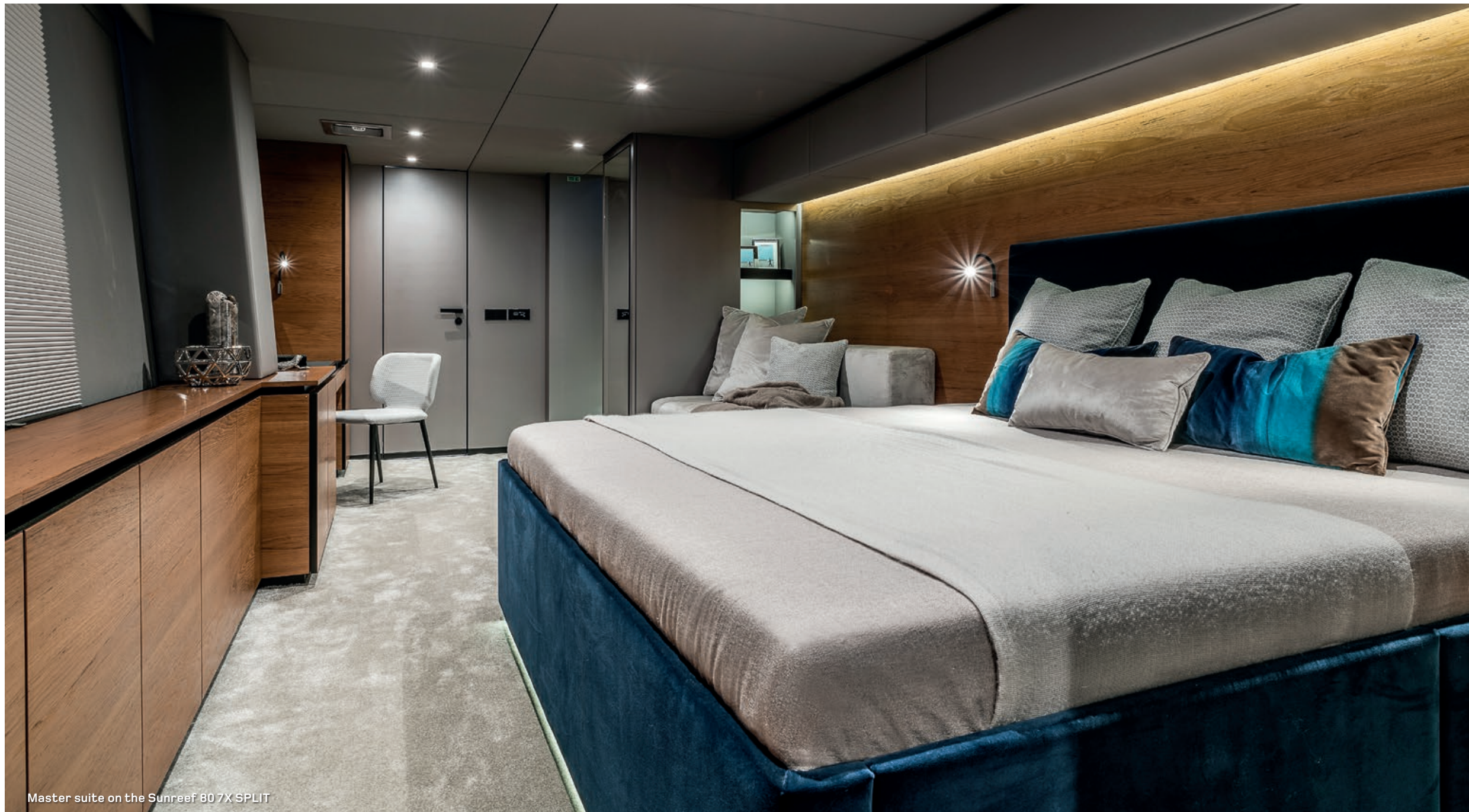
Master suite on the Sunreef 80 7X SPLIT