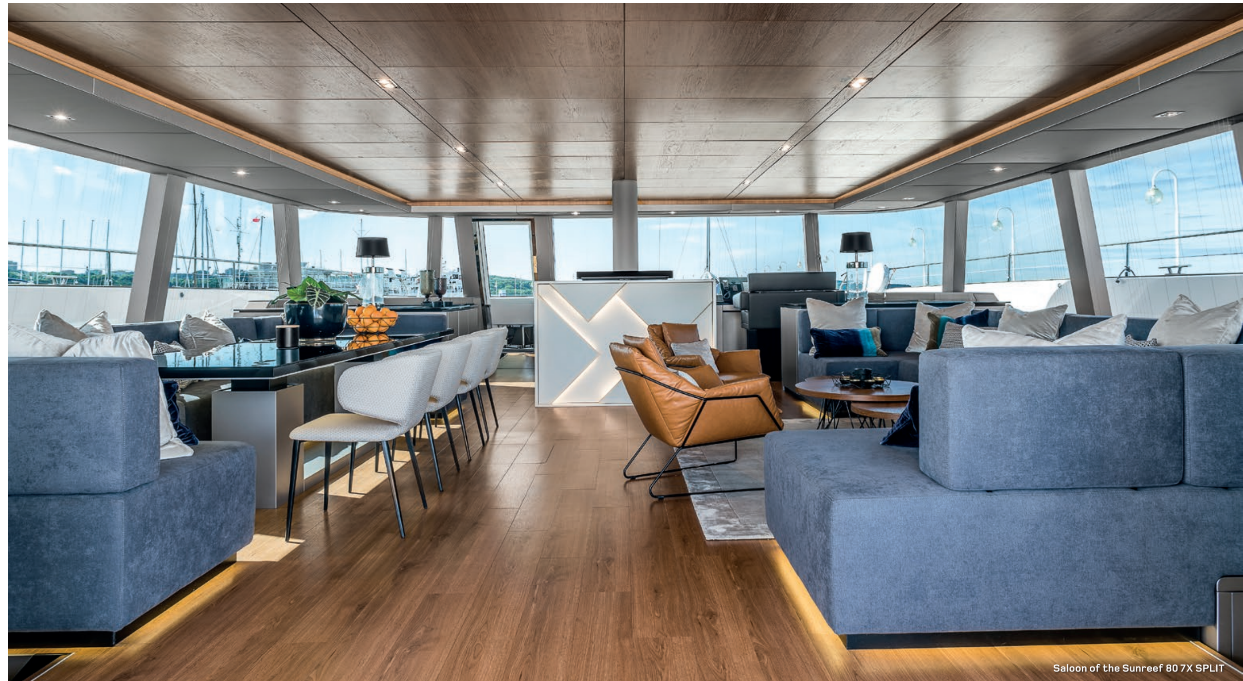
Saloon of the Sunreef 80 7X SPLIT

Grâce à sa superstructure innovante, le Sunreef 80 se dote d'un carré avec un énorme potentiel d'habitabilité et de personnalisation. La nacelle abrite un immense espace de détente offrant des possibilités illimités pour un agencement sur mesure.