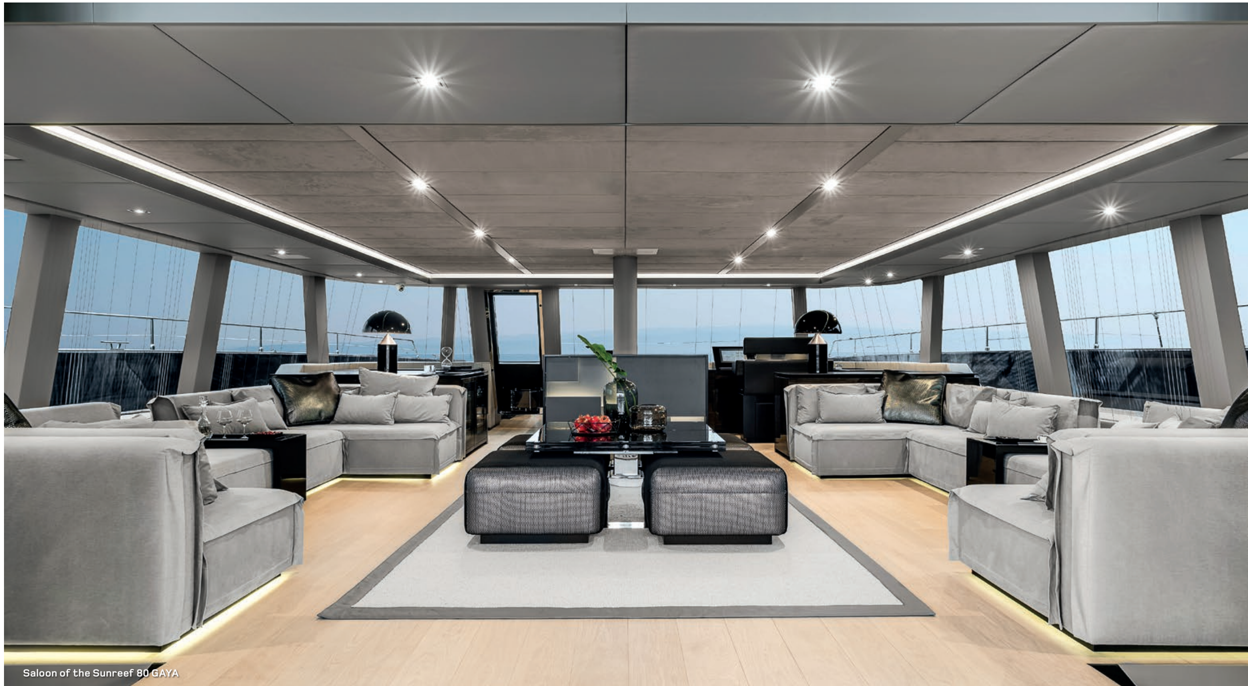
Saloon of the Sunreef 80 GAYA